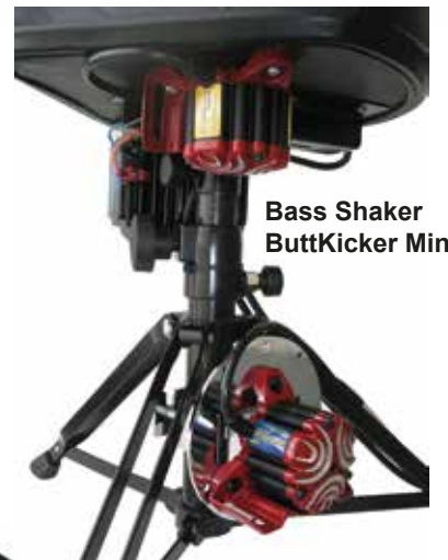
Bass Shaker ButtKicker Mini