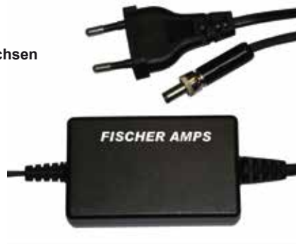
ext. DC-Netzteil optional erhältlich DC mains adapter (optional)