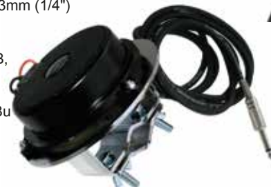
Bass Shaker Bass Pump

Drum In Ear Amp Set 1 with Bass Shaker Bass Pump [Art.No. 001102]