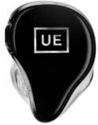
UE NEW LOGO

EIGENE INITIALEN AUFPREIS +50 € netto (MAXIMAL ZWEI BUCHSTABEN)