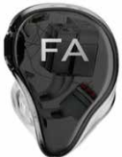
EIGENE INITIALEN CHROM

EIGENE INITIALEN AUFPREIS +50 € netto (MAXIMAL ZWEI BUCHSTABEN)